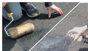
②プライマーを塗る。