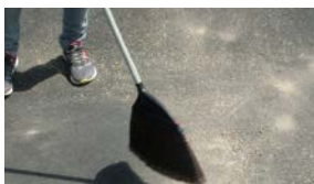
①シート設置面の清掃