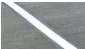
③バランスをみて、ラインを置く。