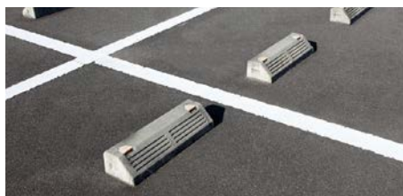
使用イメージ写真です。