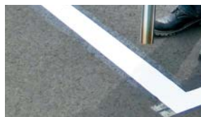
④バーナーで加熱し、溶着する。

施工したラインが冷めたら施工完了です。 お急ぎの場合は施工場所に水をかけて冷却することも可能です。